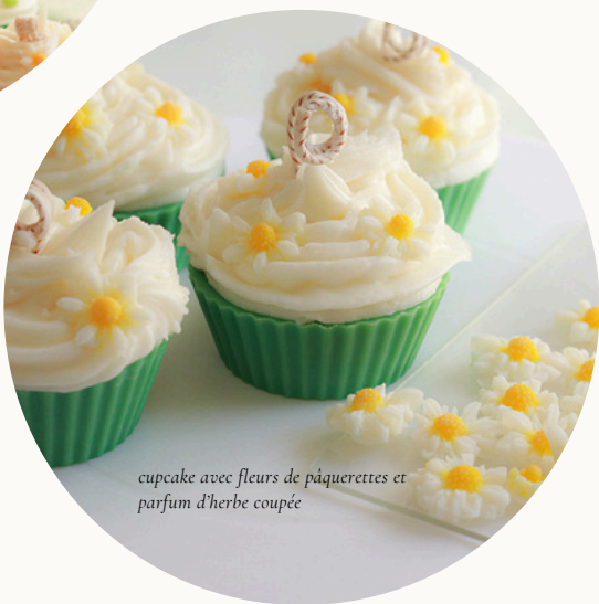
cupcake avec fleurs de pâquerettes et parfum d'herbe coupée